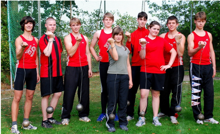
Die „Wikinger“ des MTV 49 mit ihren „Waffen“