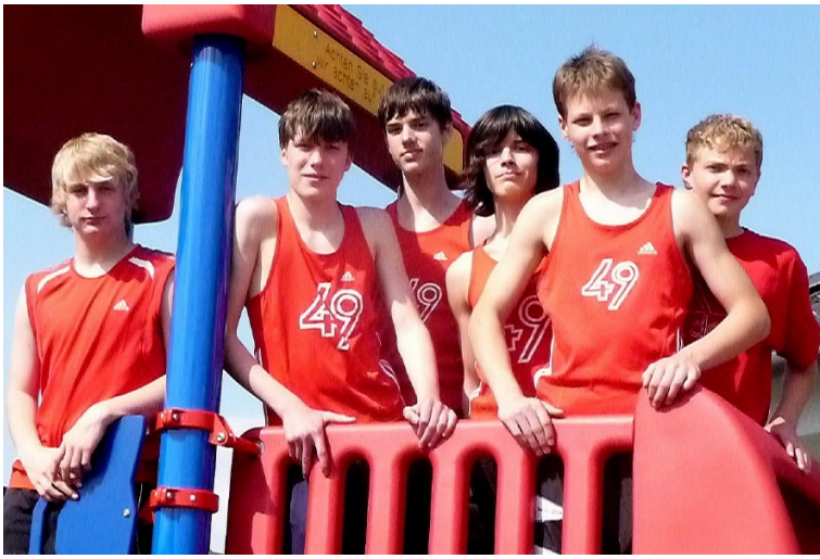
Die 4-Kampf-Mannschaft wird Bezirksmeister