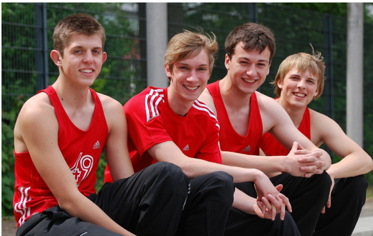
Die Sprintstaffel der A-Jugend läuft zur Vizemeisterschaft