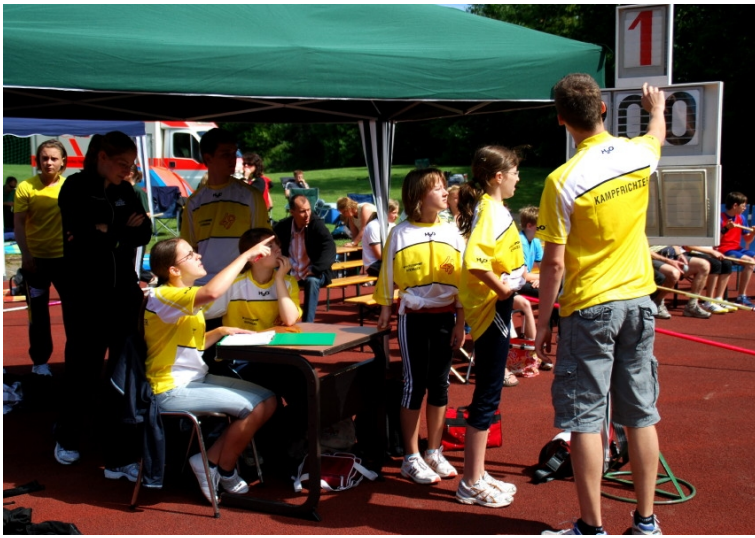
Die „gelben Engel“ des Stabhochsprung-Meetings