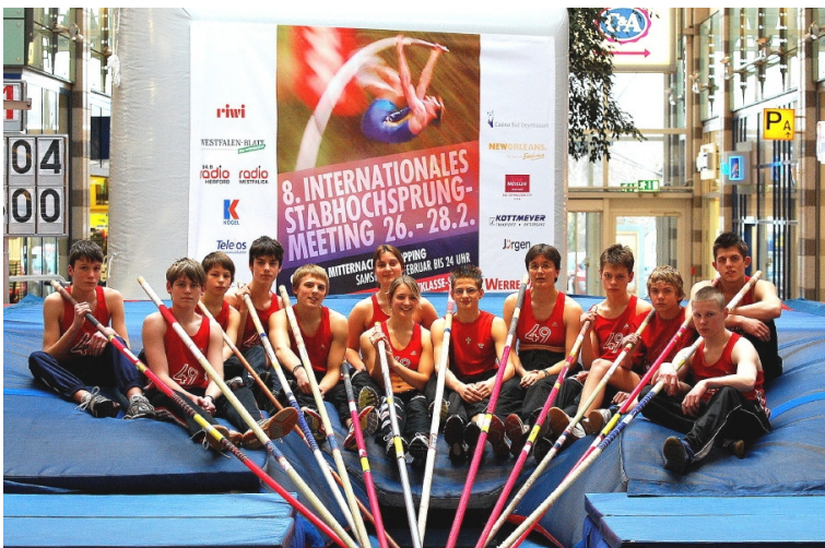
Die Stabis des MTV 49 im Werre-Park von Bad Oeynhausen